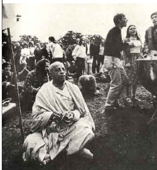
Em San Francisco, Prabhupada canta o maha-mantra num parque da cidade, com grande participação dos jovens.