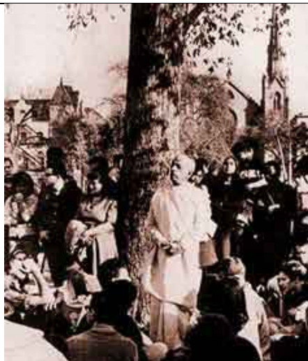
Prabhupada pregando numa praça em Manhattan, New York.