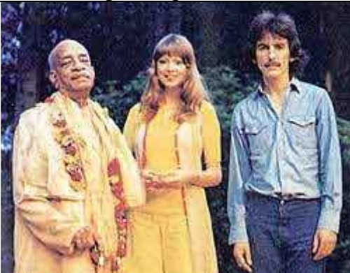
Em Londres, Prabhupada encontra-se com George Harrison, que doou uma grande propriedade para sua missão.