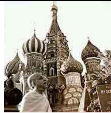
Prabhupada em Moscou.