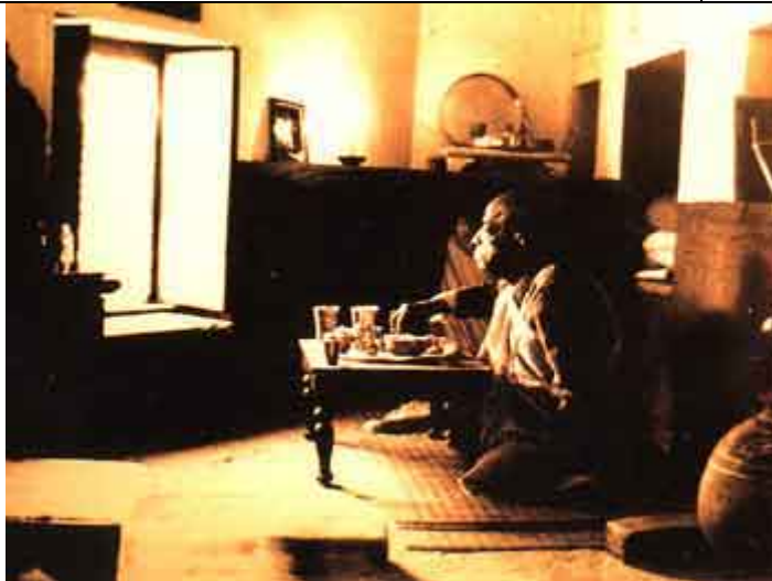
Prabhupada em seus velhos aposentos no Radha-Damodara.