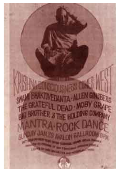
Cartaz da participação de Prabhupada no Mantra-rock Dance, em San Francisco.