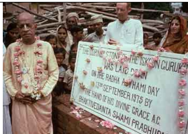
Em 1975, sua grande vitória: cerimônia da pedra fundamental do templo em Vrindavana.